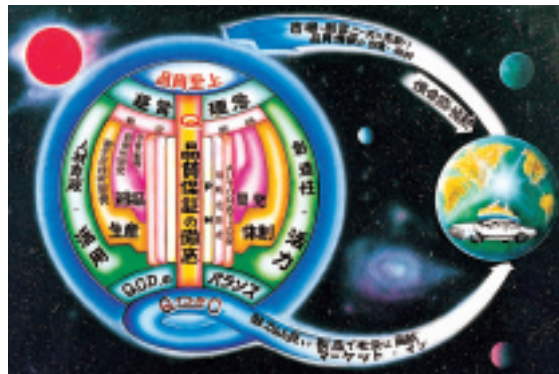
「品質至上」の概念図 Principle of “Quality Supremacy”

We believe that our most important asset is our human resources, as people are the source of our vitality and the drivers of our enterprise growth. The foundation of our company is to contribute to our customers and society through our human resources and to ensure both corporate growth and employee satisfaction. At the same time, we continue to work toward creating an eco-friendly company of the future.