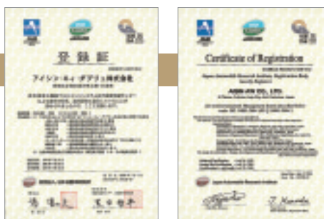
ISO 14001登録証 ISO 14001 Certificate of Registration

AISIN AW has acquired ISO 14001 certification for all its business activities. As well as strengthening our environmental protection efforts by making our operations transparent, ISO 14001 has enhanced the trust of our customers.