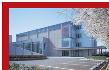
ゆとりヒルズ YUTORI HILLS

コンサートや講演などの文化活動の場であるホールやスポーツ施設、研修センターなどが整った「希望の丘」。シアターやスタジオなどを配備した「ゆとりヒルズ」などがあり、また、地域社会とのコミュニケーションを図るイベントを毎年開催し、家族や地域のみなさまにも開放され親しまれています。