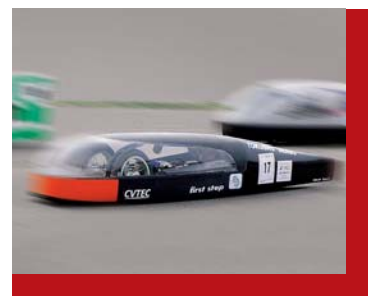
エコラン部 The Ecorun Club