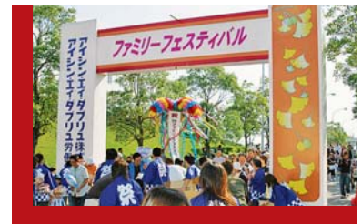
ファミリーフェスティバル Family Festival

Hopeful Hill, with its hall for cultural events such as concerts and lectures, sports facilities, and research center, is at the center of these programs, while Yutori Hills offers theaters, studios, and other facilities. Annual events designed to foster open communications with the surrounding community are popular with families and local residents.