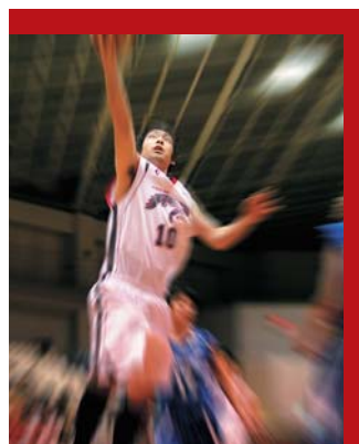
アイシン・エイ・ダブリュ アレイオンズ 安城 AISIN AW AREIONS ANJO